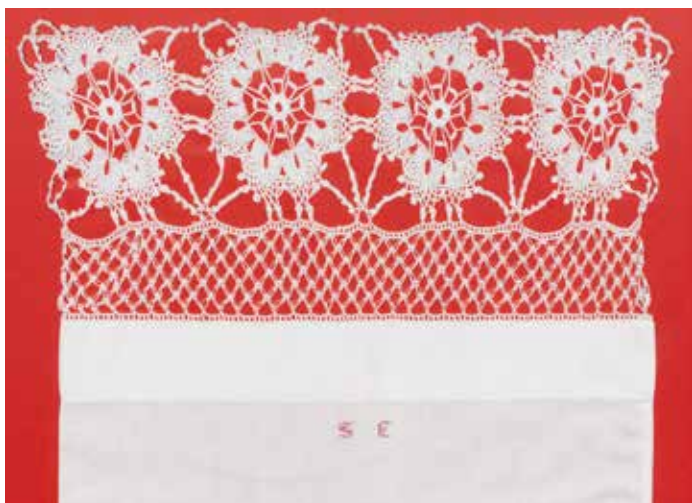
Slika 9: Del okrasne prevleke za blazino, mere celote 53 cm x 38 cm, 18 cm čipka