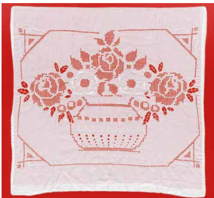
Slika 10: Prevleka za blazino z merami 39 cm x 39 cm