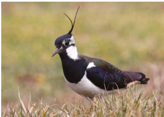
Priba (© Alen Ploj)