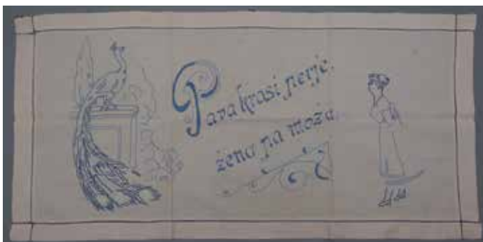
Slika 5: Stenski prt z merami 53 cm x 109 cm

Slavka Ivačič hrani tudi več stenskih prtov različnih dimenzij in napisov: Najlepša je navada če v hiši sloga vlada; Red in snaga, sta vsakomu draga; Dober Tek!; Edina sreča za moža če žena dobro kuhat zna; Daj nam danes naš vsakdanji kruh ... Predstavljeni stenski prt (sl. 5) je vezen v svetlo in temno modri ter beli prejici v polnem in stebelnem vbodu z zankami za obešanje. Napis se dopolnjuje z motivom pava in gospodinje.