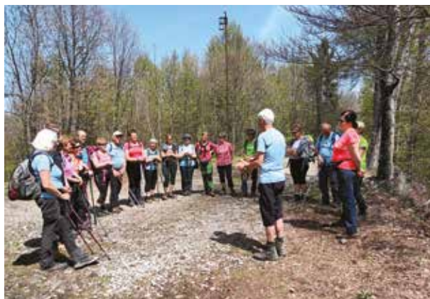
(© Anica Kremžar)