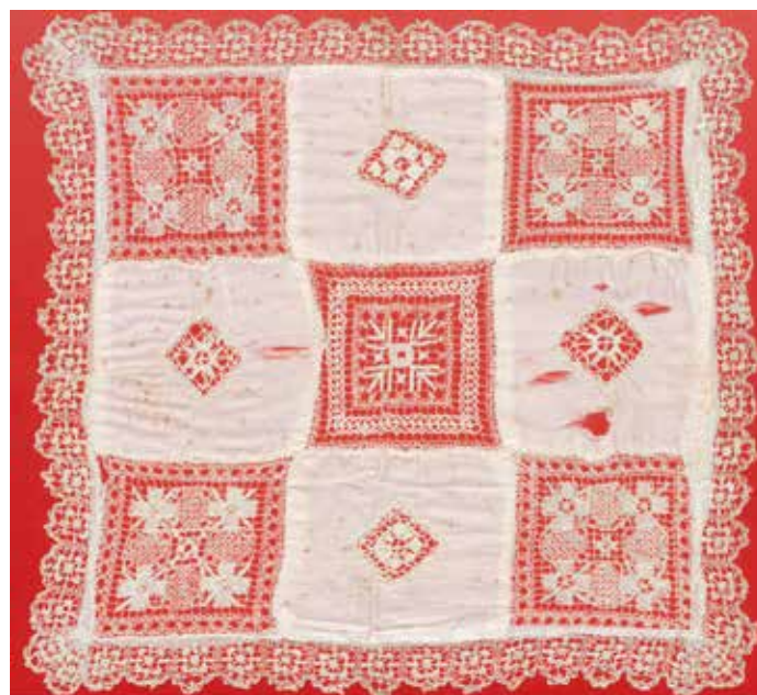
Slika 8: Prevleka za blazinico, mere 39 x 40 cm, 5 cm čipka (© Katarina Skuk)

Prevleka za okrasno blazinico iz svile (sl. 8) je prelep izdelek, ki ga sestavljajo pet večjih kvadratnih čipk z merami okrog 12 x 12 cm in štiri manjše čipke z merami okrog 4 x 4 cm, prevleka je tudi obrobljena s čipko. Na zadnji strani so štirje gumbi. Gre za tako imenovane mrežene čipke (ponekod jim rečejo tudi necana čipka ali file čipka). Sodi med čipke mešanih tehnik, ker je osnovna mreža narejena z eno tehniko (vozlanje ali klekljanje), vzorec s polnili pa z drugo (šivanje). Prevleko lahko datiramo na konec 19. stoletja oziroma začetek 20. stoletja. Po pripovedovanju Slavke Ivačič so to prevleko za blazinico uporabljali za otroški voziček.