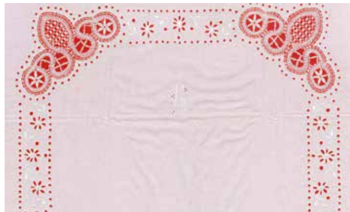
Slika 7: Prevleka za vzglavnik, mere 64 cm x 79 cm

Prevleko za vzglavnik (sl. 7) krasita več tehnik vezenja; čipki, rišelje in polni vbod, s katerim je izvezen monogram I(da) K(račna). Prevleka se zapenja s petimi »cvirni knofi«. Tudi to prevleko je naredila Jedert Selan.