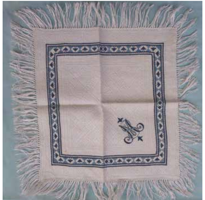
Slika 1: Prtiček z merami 28 x 30 cm in 5 cm resicami