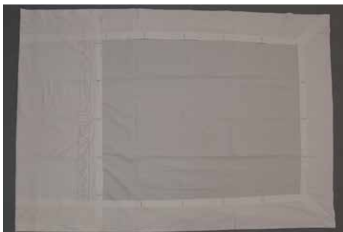
Slika 6: Kapna, mere 125 cm x 174 cm

Prevleka za odejo (sl. 6), kapna, je šivana iz platna. Velikost zgornje rjuhe se ravna po odeji, dodana je širina za zavihke; stranska zavihka in spodnji zavihke po 19 cm, zgornji zavihke 46 cm krasita vezenina v rišelje tehniki ter izvezen monogram KI.