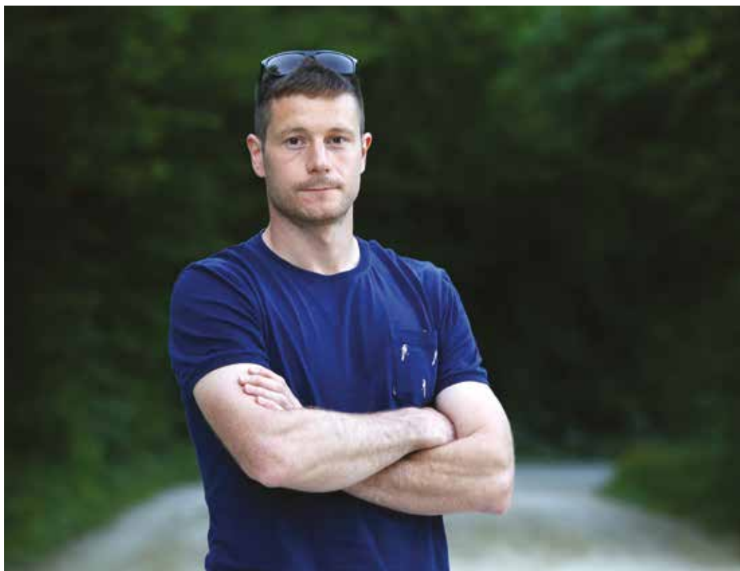
Preudaren in zanesljiv, ne le na ledu.

Na ledu se ustvarijo prijateljstva za zmeraj. Večkrat sem že povedal, da dihama