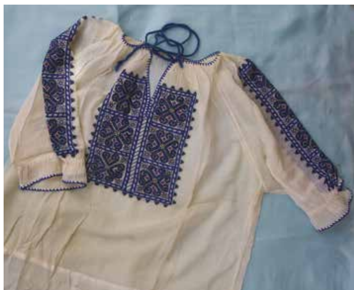
Slika 13: Ženska bluzo iz organze s križci, mere 62 cm x 100 cm

Tudi žensko bluzo (sl. 13) je naredila Jedert Selan za hčerko Ido, za njo jo je nosila Slavka. Narejena je iz organze, tanke tkanine z leskom. Krasi jo čudovita vezenina z drobnimi križci, narejena s tanko pretežno modro nitjo, ki jo sestavljajo stilizirani geometrijski sklopi, na prsnem delu dvakrat po trije, na vsakem rokavu pa po štirje. Vratni izrez ter rob rokavov so zaključeni z dvojnim zančnim vbodom.