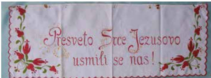
Slika 4: Prtič z merami 27 cm x 72 cm

krasita cvetlična vzorca. Na zgornjem delu so zaradi uporabe opazne rjaste sledi žebličkov.