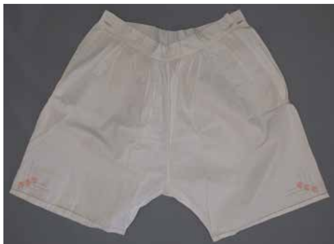
Slika 11: Ženske spodnje hlače z merami 52 cm x 83 cm