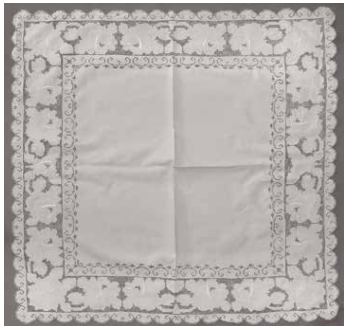
Slika 2: Prtič, izvezen v sicilskem ažuru, mere 71 cm x 76 cm (© Ljubo Vukelič)

V zbirki je tudi več umetelnih prtičkov, delo Jedert Selan, izvezenih v sicilskem vbodu (sl. 2). Pri tej tehniki je treba najprej na tkanini izvleči niti, ki so označene na shemi. Tako dobimo osnovo za luknjičaste motive, ki so izvezeni s sicilskim ažurom oziroma vbodom.