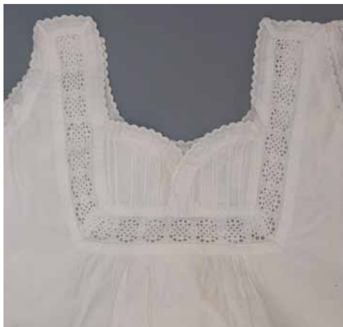
Slika 12: Mere: prsni obseg 114 cm, spodnja širina 196 cm, dolžina 105 cm