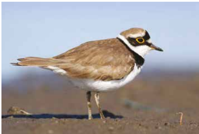
Mali deževnik

Medtem ko bodo zgoraj naštete vrste kmalu zapustile Cerkniško jezero ter nadaljevale let proti gnezdiščem v bližini arktičnega kroga, pa se je nekaj parov prib in malih deževnikov že ustalilo ter začelo gnezdit; mali deževniki nasploh prvič potrjeno gnezdiijo na Cerkniškem jezeru. Morda na prvi pogled vsa ta izpostavljena zemljina ob Strženu kazi podobo jezera, a pogled od blizu razkrije, da tudi tako okolje še kako vrvi od življenja! ■