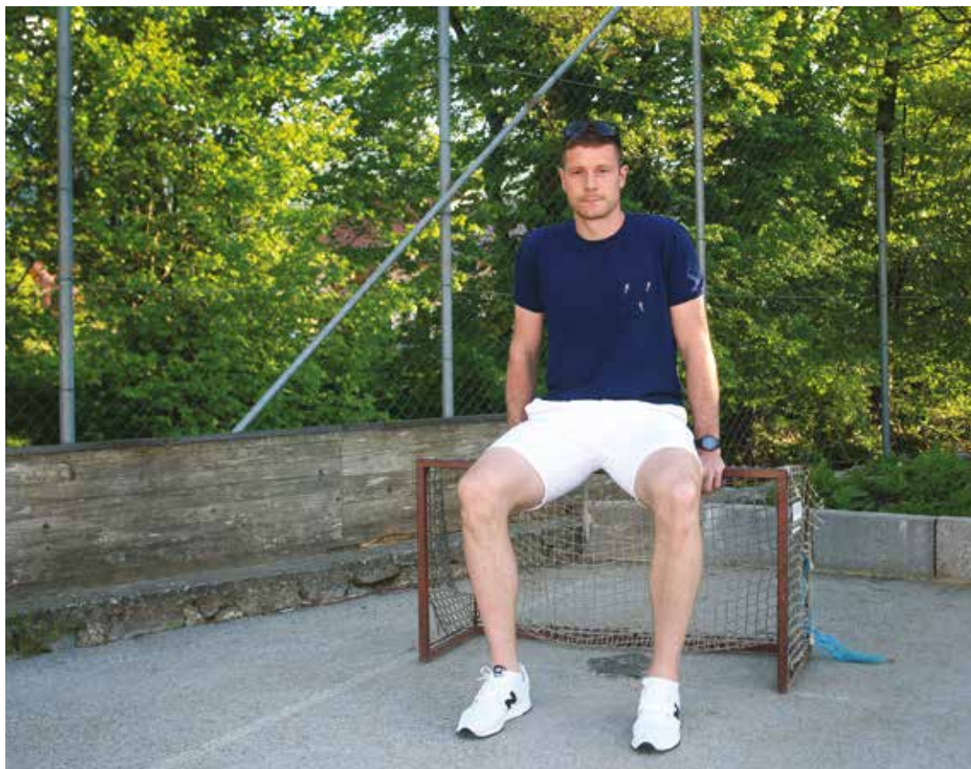
Jan med sezono redno spremlja novice iz domačih krajev.

To je zelo zoprno, ampak ko si starejši in imaš izkušnje, je to dosti lažje spremeniti. Ko si mlajši, razmišljaš samo