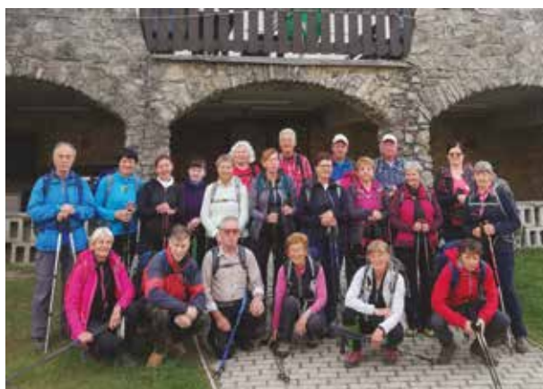
(© Štefka Šebalj Mikše)