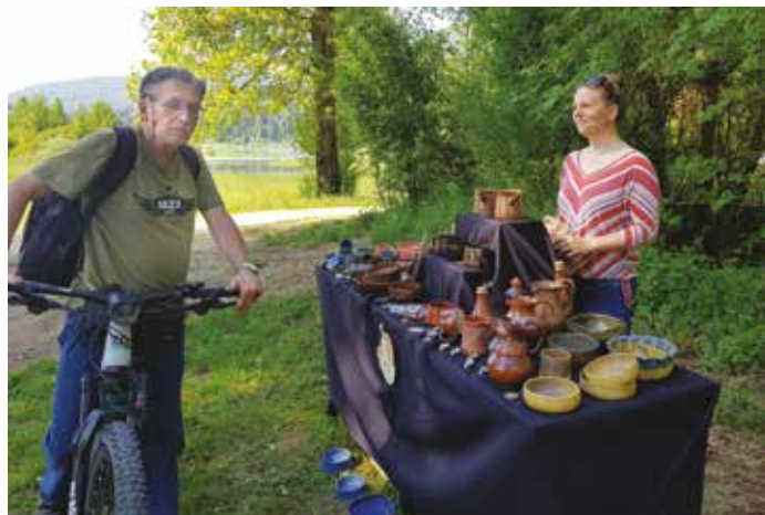
Info točka

Da smo novo informacijsko točko lahko postavili, smo neznansko hvaležni Agrarni vaški skupnosti Dolenje Jezero, ki je lastnica zemljišča in se je z njeno vzpostavitvijo več kot le strinjala. Njen namen je tudi usmerjanje obiskovalcev na lokacije, kjer ne motijo živali in ne posegajo v zasebno lastnino domačinov. ■