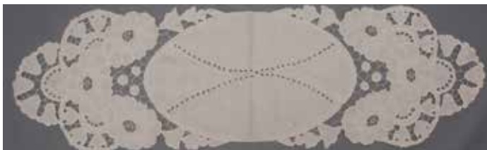
Slika 3: Prtiček z merami 33 cm x 110 cm (© Ljubo Vukelič)